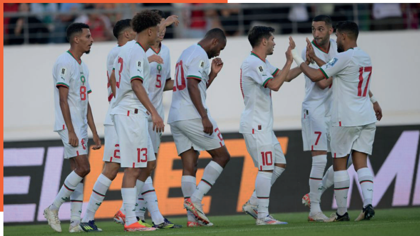
فرحة لاعبي المنتخب بعد تسجيل الهدف

بين سلوك اللاعبين والأداء التقني الذي تراجع بشكل كبير بالنسبة لفئة عريضة منهم، دقت الجماهير ناقوس الخطر رغم نتيجة الفوز، بسبب هفوات قد تكلف المجموعة الكثير خلال مباريات مماثلة. وحاول الناب الوطني توجيه خطاب