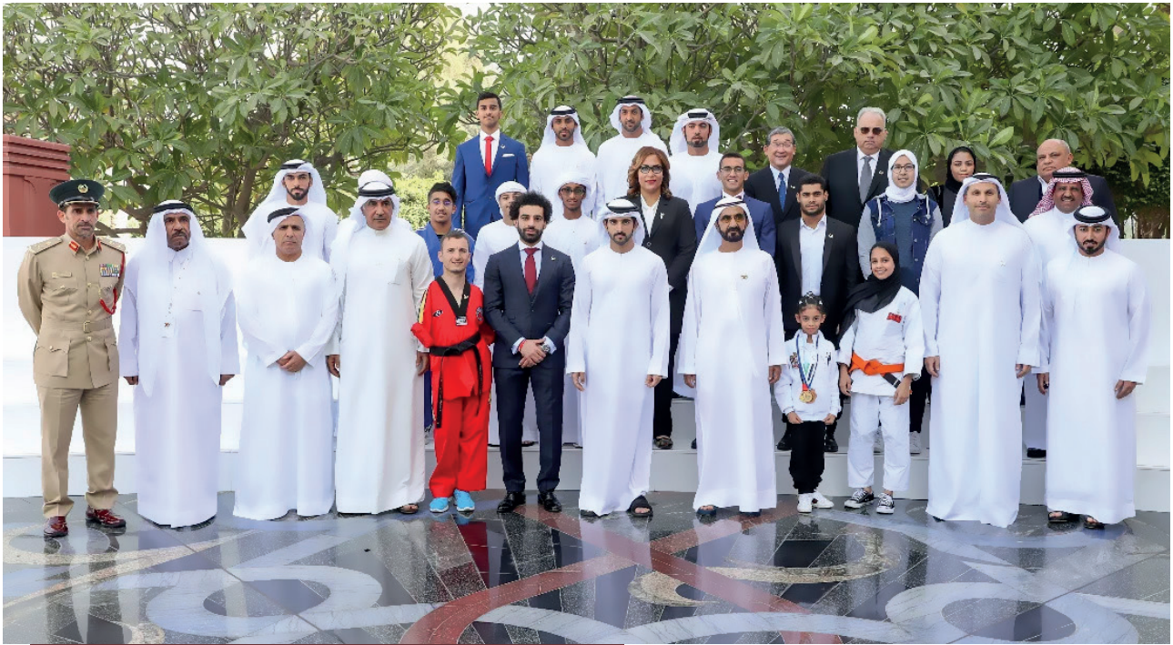
الفديني إلى جانب الدولي المصري محمد صلاح ومسؤولين إماراتيين

أكيد، فالمملكة المغربية غنية بتنوع الأجناس البشرية المنبثقة من مجموعة من المناخات والمناطق