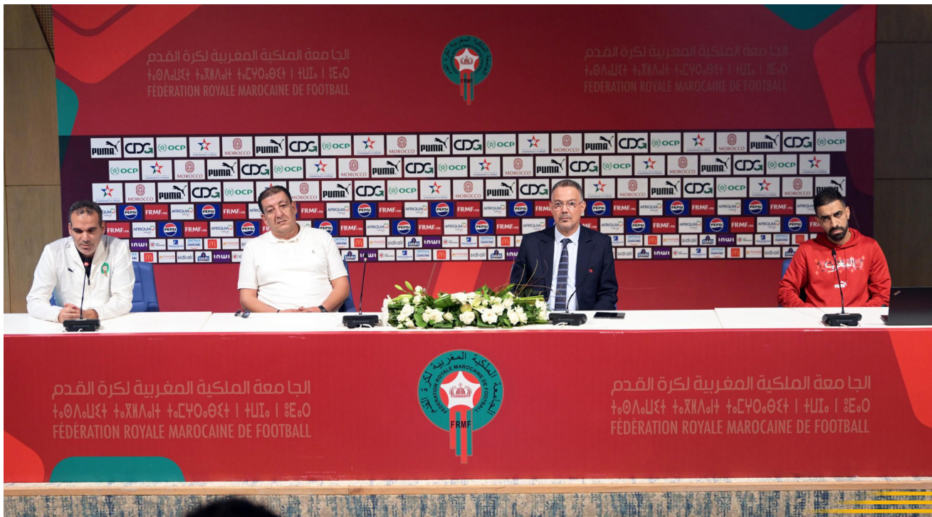
لفجر رئيس الجامعة لحي استقباله للمنتخب المغربي للفوتسال

وأوضح رئيس الجامعة الملكية المغربية لكرة القدم، أن سقف آمنيات الجماهير المغربية لا حدود لها، داعياً جميع المسؤولين عن كرة القدم داخل القاعة إلى وضع برنامج عمل قابل للتطبيق يهدف للنهوض بهذا النوع الرياضي،